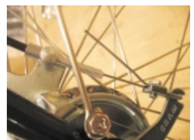
Montar cable en soporte

9. Colocar el cable del freno delantero. Lo primero es colocar el cable del freno de mano en el puño para después pasar el cable por el soporte de la horquilla. A continuación es recomendable montar el cierre al cable. Finalmente el cable debe ser fijado al tambor de freno situado en el buje.