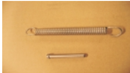
Espiral / Muelle entre cuadro y horquilla