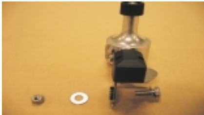
Para el montaje del dinamo