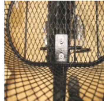
Visto desde arriba

Finalmente debes asegurarte que todos los tornillos y tuercas están apretadas. Después de haber utilizado tu nueva bicicleta Pilen una temporada es buena idea repasar y apretar todos los tornillos para asegurar que están bien fijados. Para resolver cualquier problema o duda debes ponerte en contacto con avantum (distribuidor para España) o visitar el lugar donde compraste la bicicleta.