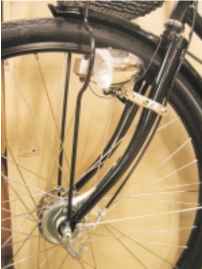
Los tirantes del soporte en “U”