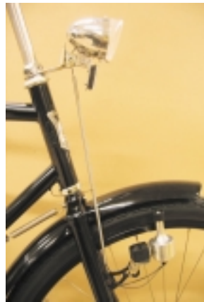
Montaje de la luz delantera.

Modelo barra baja. En el modelo de barra baja, es necesario fijar la luz en la horquilla y el dinamo en el lado opuesto. La luz a la izquierda y el dinamo a la derecha. El soporte izquierdo de la cesta no es recto y deja espacio para la luz, con lo cual es importante fijar esta en la horquilla a la altura correcta. Por eso, es recomendable que vuelvas a ajustar la posición de la luz después de montar la cesta trasera.