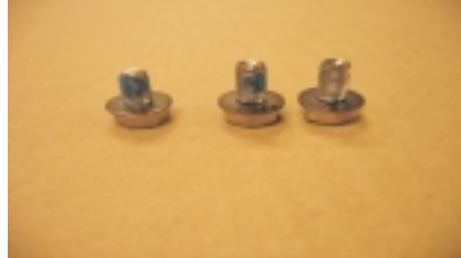
Tornillos para guardabarros delantero de 10 mm