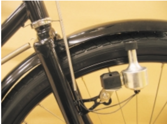
Modelo barra alta. El dinamo se fija a la horquilla derecha.