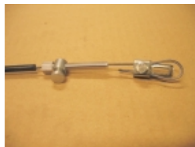
Montar cierre al cable

8. Colocar el cable de los cambios. Pasarlo dentro de las abrazaderas de plástico situadas en el cuadro, pasar el cable por encima del pedalier y, con las dos abrazaderas de plástico incluidas, fijarlo a los tirantes bajos del cuadro. Para instrucciones más detalladas de cómo fijar el cable de cambio de buje, ver las instrucciones incluidas de SRAM.