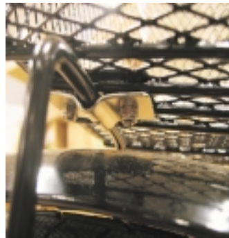
Fijar la parte de debajo de la cesta al soporte en “U”