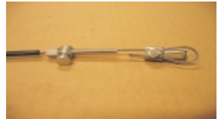
Montaje del cable de freno de mano