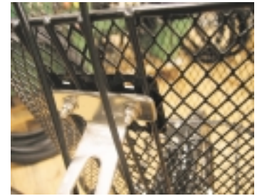
Visto desde atrás