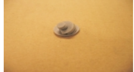
Tapa tornillo manillar