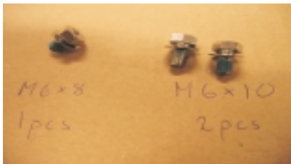
Tornillos M6 8mm y M6 10mm para horquilla delantera

Para facilitar el montaje de tu bicicleta Pilen te pedimos que sigas los pasos descritos a continuación. Puedes ensamblar la bicicleta en aproximadamente 15-30 minutos y las herramientas que necesitas son una llave inglesa y una llave allen. Abre la caja y saca todo el contenido. Retira el plástico del cuadro y todo el material de protección. Junto con la parte parcialmente ensamblada de la bicicleta encontrarás la rueda delantera con guardabarros, manillar y potencia, una caja de accesorios que contiene el sillín, tija de sillín, dos pedales y varios tornillos y tuercas.